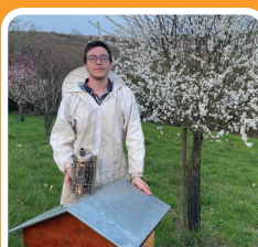
THI'POT DE MIEL

l'installation d'un système d'épandage des eaux usées sur les cultures de Houblons !