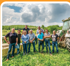
LA PERLE DES FOINS

une savonnerie artisanale dans l'acquisition d'un outil de découpe à savon !