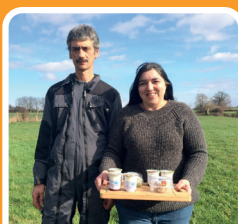
CHÈVRERIE DEL FERRIERE

une chèvrerie engagée dans la production de ses fromages !