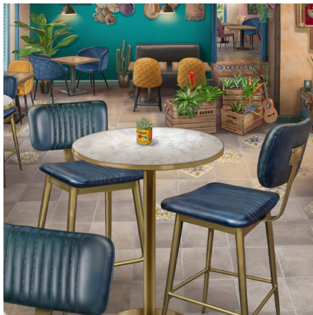
TENDANCE BOHO 00-00