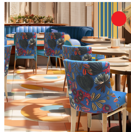
TENDANCE MAXIMALISME 00-00