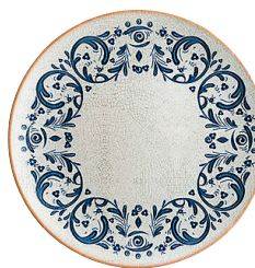
ASSIETTE PLATE "VIENTO" BONNA Porcelaine. Ø 27 cm. Adaptée au lave-vaisselle. Réf. 290824