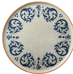
ASSIETTE À PIZZA "VIENTO" BONNA Porcelaine. Ø 32 cm. Adaptée au lave-vaisselle. Réf. 292378