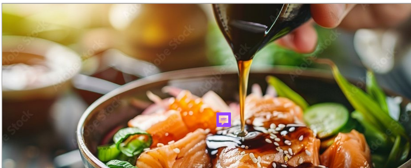
PÂTE MISO ROUGE HIKARI MISO Réf. : 149753 la barquette 300g