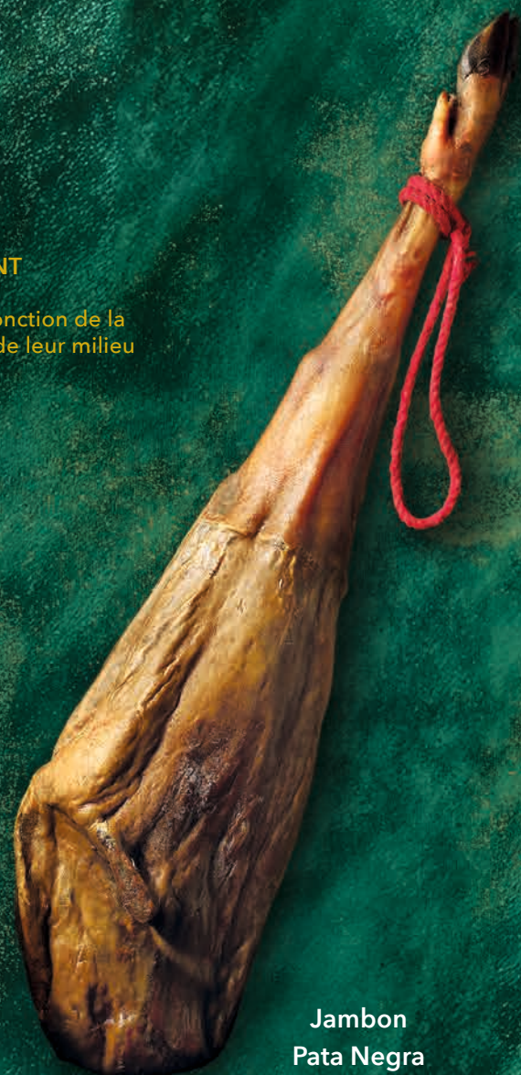
Jambon Pata Negra

Cebo Élevage à l'intérieur. Se nourrit de céréales + complément à base de légumes.