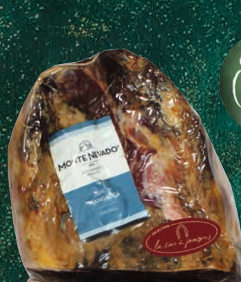
JAMBON SEC "MANGALICA" Réf. : 151319 en demi 2,6kg environ le kilogramme