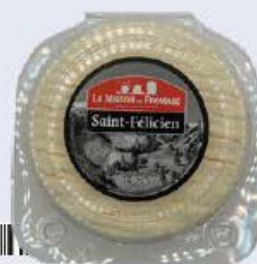
SAINT-FÉLICIEN Réf. : 298048 la pièce 180g