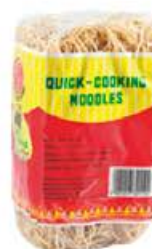
NOUILLES INSTANTANÉES Réf. : 161696 quick-cooking le sachet 500g