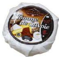
TOMME DE SAVOIE AU LAIT CRU I.G.P. LA DENT DU CHAT Réf. : 235937 28% M.G. le kilogramme