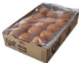
PAIN BURGER BRIOCHÉ CREATIV BURGER Réf. : 309458 le plateau de 30 pièces La pièce 80g