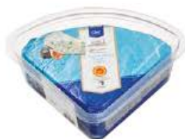
GORGONZOLA A.O.P. 1/8 ORIGINE ITALIE METRO CHEF Réf. : 084736 la pièce 1.5kg environ