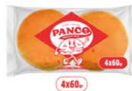
PAIN BURGER POTATOE BUN PANCO Réf. : 312442 le sachet de 4 pièces de 60g