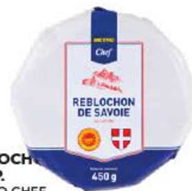
REBLOCHON A.O.P. METRO CHEF Réf. : 287372 la pièce 450g environ