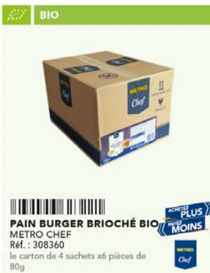
PAIN BURGER BRIOCHÉ BIO METRO CHEF Réf. : 308360 le carton de 4 sachets x6 pièces de 80g