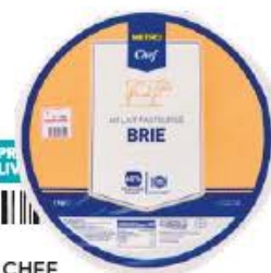
BRIE METRO CHEF Réf. : 071260 60% M.G. la pièce 3kg environ