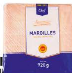
MAROILLES METRO CHEF Réf. : 243553 la pièce 720g