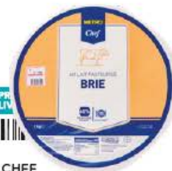
BRIE METRO CHEF Réf. : 071260 60% M.G. la pièce 3kg environ