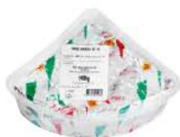
GORGONZOLA A.O.P. 1/8 ORIGINE ITALIE L'ANGELO BARUFFALDI Réf. : 247365 pointe 1/8 le kilogramme