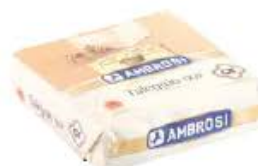
TALEGGIO A.O.P. ORIGINE ITALIE AMBROSI Réf. : 007611 pièce 2kg environ le kilogramme