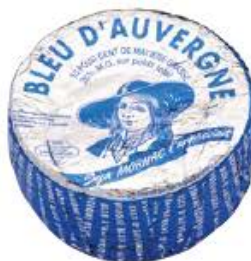
BLEU D'AUVERGNE A.O.P. MORNAC Réf. : 236134 pièce 2,4kg environ