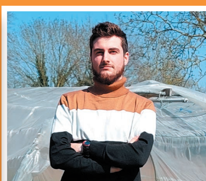
L'ENDIVE MARESCOISE 59