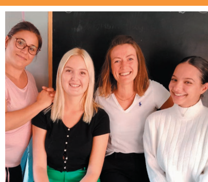
LA FÉE MARAÎCHÈRE 57

Soutenons la création d'une unité de micro-méthanisation à la ferme !