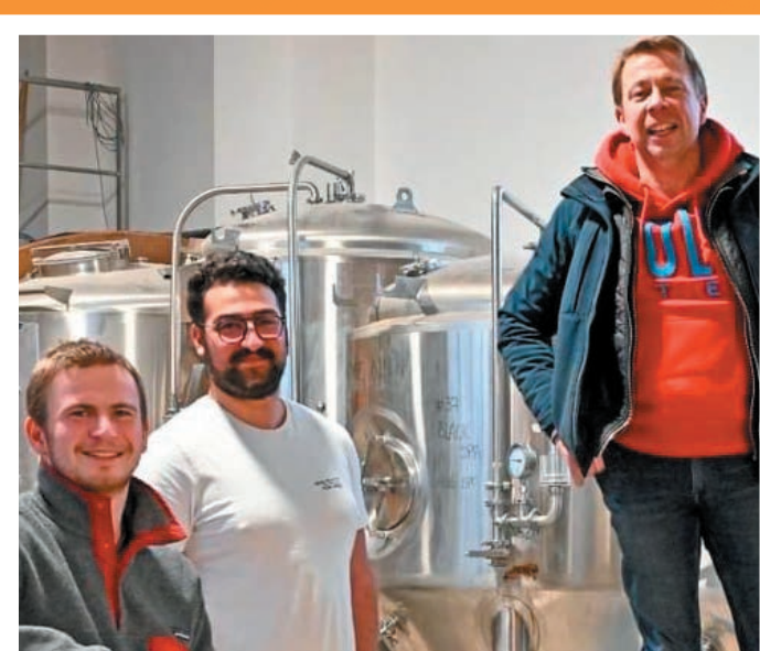
LES TOURS DU MALT 59

Supermarchés Match soutient depuis toujours les producteurs locaux. Les projets de 10 producteurs partenaires seront financés grâce à vous, via l'association « La Cagnotte des Champs ». Ils pourront ainsi développer et concrétiser leurs projets d'agriculture durable et locale. Tous ensemble, soutenons nos Producteurs Locaux !