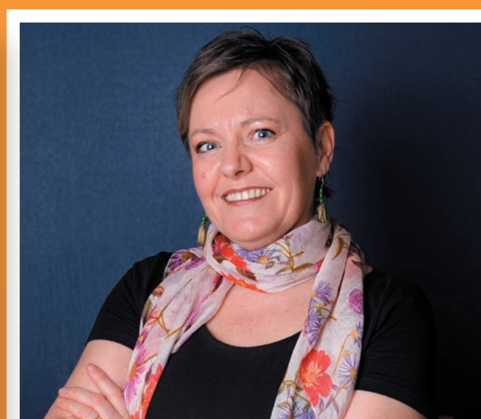
LABO DUMOULIN 67

Soutenons Ludovic pour pérenniser son exploitation avicole !