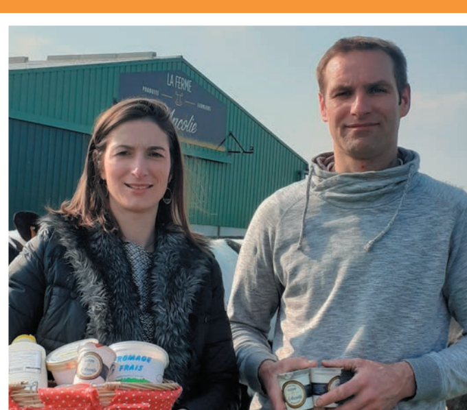
LA FERME D'ANCOLIE 59