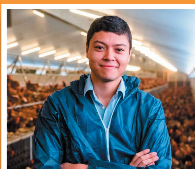
LES CH'TITES POULES 59

Aidons les Vergers du Comté à produire de l'énergie verte !