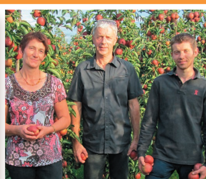
LES VERGERS DU COMTÉ 59