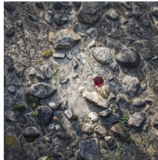
Fond vin rouge : verre de vin rouge.

3 sortes de fonds pour les vedettes : le verre de vin est l'élément différenciant : il doit être bien visible.