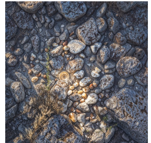
Fond vin blanc : verre de vin blanc.