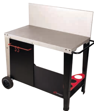
DESSERTER SALVIA POUR PLANCHA SOMAGIC*

Desserte en métal 90 x 47 cm avec crédence. Plateforme de rangement avec panier porte-bouteilles, et crochets porte-accessoires. Permet de poser votre plancha en toute simplicité à l'endroit souhaité. Facilite le service et le déplacement. Complet, prêt à l'emploi.