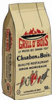
CHARBON DE BOIS GRILL O' BOIS

Cuve en fonte 54,5 x 38,5 cm. Parevent en acier laqué avec hauteur de grille réglable. Grille de cuisson en acier chromé 51 x 37,2 cm. Chariot stable et robuste avec tablette latérale en bois, plateforme de rangement et crochets porte-accessoires. Longévité du foyer. Convient pour 10 personnes. Permet un réglage optimum de la cuisson par rapport à l'intensité du feu.