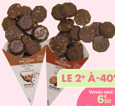
CORNETS DE CHOCOLATS MAISON TAILLEFER

Bulles fines et notes fruitées. Pour un moment de célébration, à l'apéritif ou en dessert. La bouteille de 75 cl.