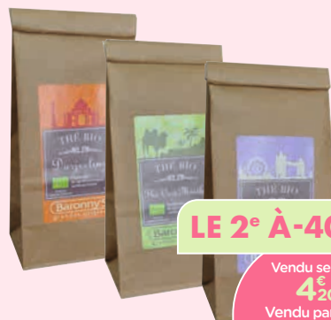
SÉLECTION DE SACHETS DE THÉ EN VRAC BIO BARRONY'S - 50 G*

Existe en chocolats au lait fourrés au spéculoos 130 g et chocolats au lait croustillant 130 g. Existe aussi en billes de céréales enrobées aux 3 chocolats 140 g.